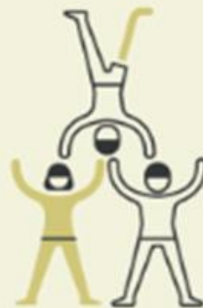
Deltakelse & inkludering