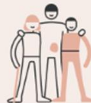
Respekt for forskjeller