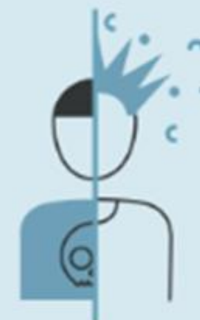
Respekt for utviklingsmulighetene og identiteten til barn